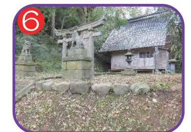
浜徳合 諏訪神社 海拔 23.0m