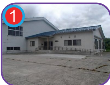
磯部ふれあい会館 (指定避難所) 海拔 17.0m