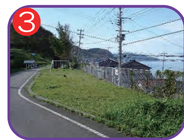
中郷児童遊園 海拔 15.1m