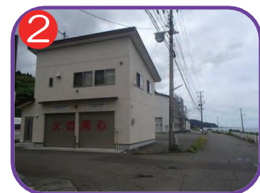
磯部分団拠点化格納庫 海拔 14.0m