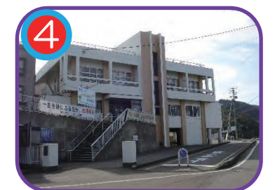
磯部地区公民館 (指定避難所) 海拔 17.0m