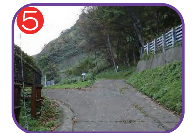
海に見える丘公園 海拔 18.9m